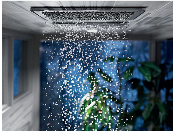
Figura 7: Ducha Kohler Real Rain

Estudiando todos los elementos de una ducha con lluvia natural, desde la variedad de tamaño de las gotas hasta los ángulos desde los que caen, Kohler ha creado Real Rain, una experiencia en la ducha que transporta al usuario más allá del evento diario. La lluvia suele ser un iniciador de conversaciones.