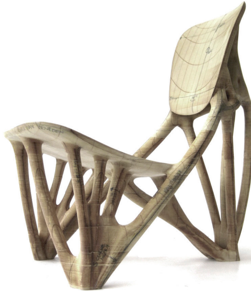
Figura 3: Silla Bone de papel