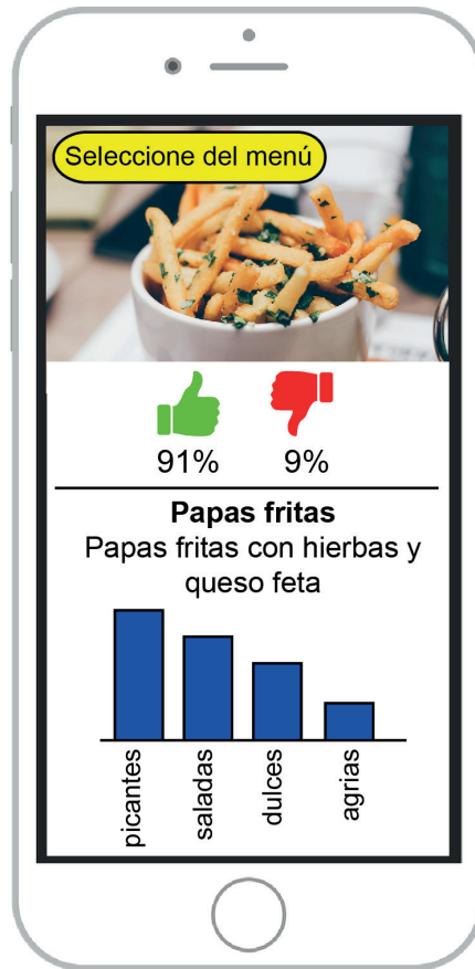
Figura 1: App Tasty