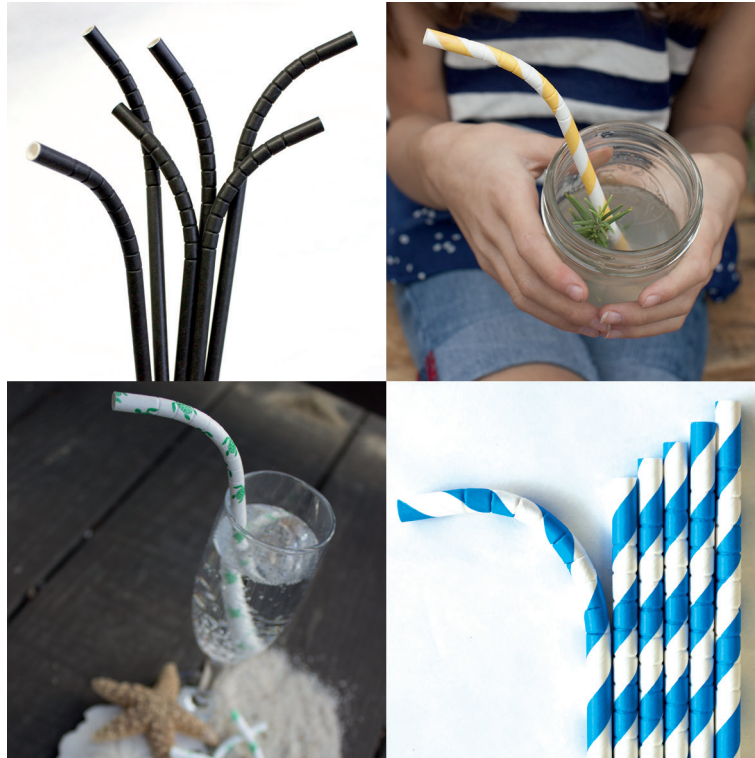
Figura 2: Paja Eco-Flex